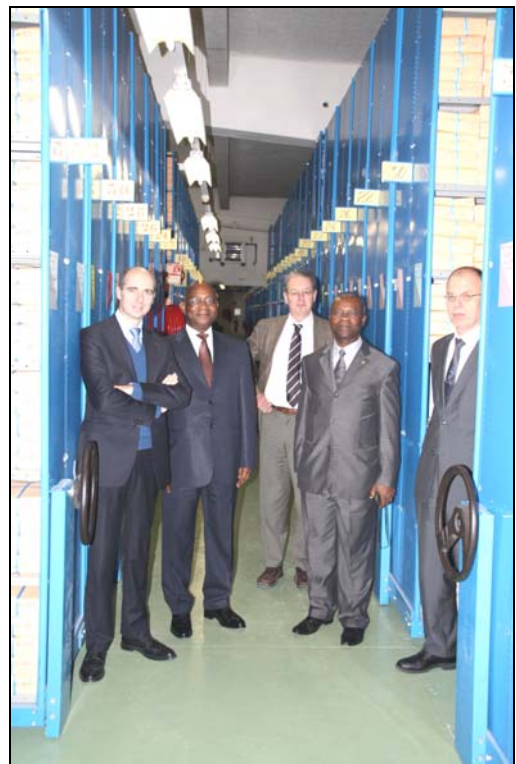
Du 15 au 19 novembre 2010