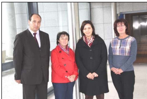
Les administrateurs de la Cour des comptes de Tunisie Le 5 octobre 2010

Ils se sont particulièrement intéressés aux procédures d'élaboration d'exécution et d'évaluation budgétaires dans le contexte d'un budget par objectif.