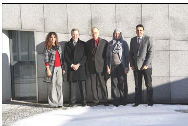
Auditeurs de la Cour des comptes du Royaume du Maroc Du 29 novembre au 9 décembre 2010

C'est ainsi que trois auditeurs marocains ont effectué à la chambre à la fin de l'année 2010, une formation de deux semaines consécutives au cours de laquelle ils ont rencontré de nombreux magistrats et responsables de services administratifs, afin de s'imprégner de leur expérience acquise au sein des chambres régionales de comptes.