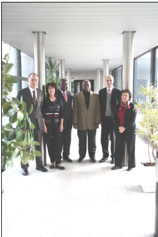
Du 1 er au 5 février 2010